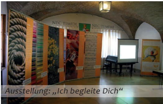
Ausstellung: „Ich begleite Dich“