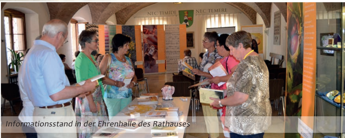
Informationsstand in der Ehrenhalle des Rathauses

Anlässlich des Welthospiztages im Oktober 2013 bestückten wir einen Informationsstand vor dem Rathaus und legten Unterschriftenlisten aus, bei denen sich interessierte Mitbürger eintragen konnten, um für die Verbreitung der Grundsätze und Rechte die in der Hospiz-Charta niedergelegt wurden, zu sorgen.