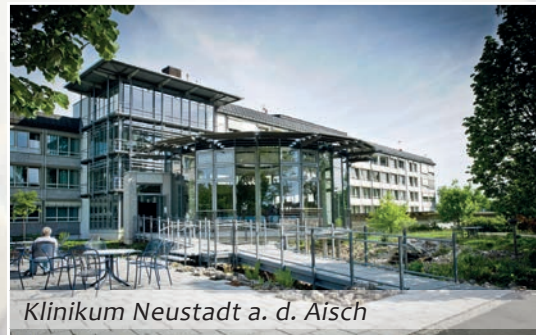
Klinikum Neustadt a. d. Aisch

entenversorgung und Humanität der Betreuung. Durch die bestmögliche Unterstützung auch der Angehörigen wird den Kranken durch die SAPV eine optimale Versorgung im häuslichen Umfeld ermöglicht. Bei Bedarf wird