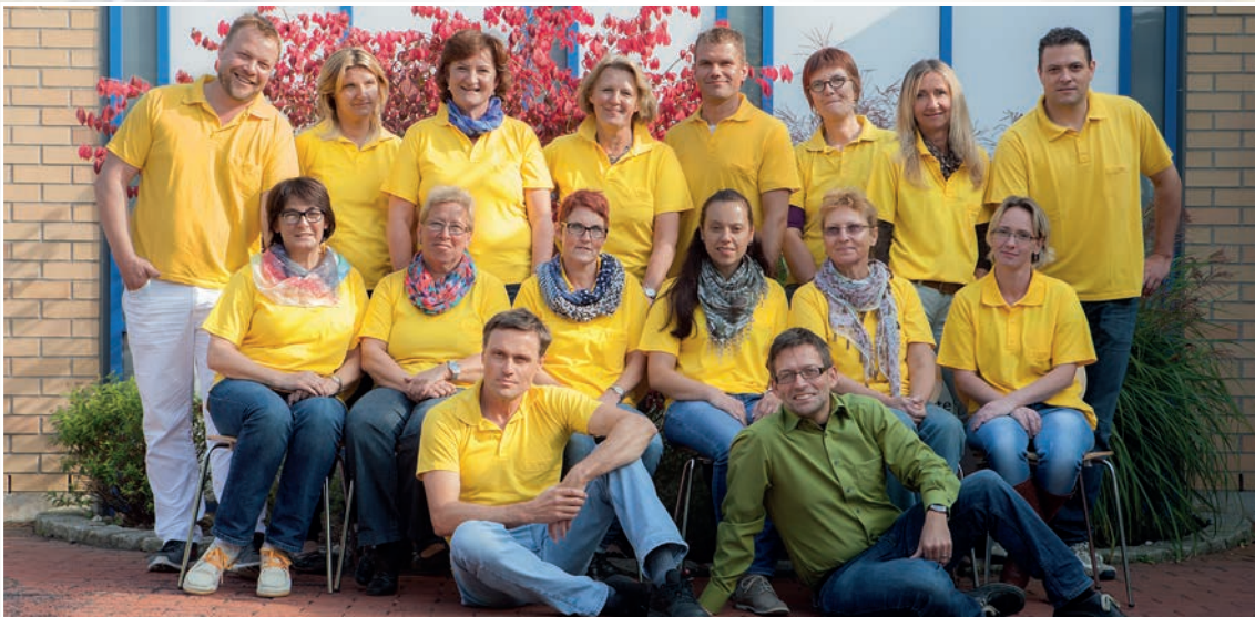
Das gesamte SAPV-Team der Sozialstiftung Bamberg

Das multiprofessionelle Team, bestehend aus Ärzten und Pflegekräften mit jeweils fachspezifischer Zusatzqualifikation und jahrelanger Praxiserfahrung, ermöglicht zahlreichen Menschen das Leben zu Hause bis zuletzt- und das sowohl in der eigenen Häuslichkeit, als auch in Seniorenheimen.