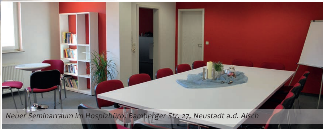
Neuer Seminarraum im Hospizbüro, Bamberger Str. 27, Neustadt a.d. Aisch

Wir verfügen endlich über angemessene Räumlichkeiten – Büro und Seminarraum – um in gebotener Ruhe mit Hilfesuchenden zu sprechen und herauszufinden, wie wir helfen können. So können wir erstmals geregelte Büro- und Sprechzeiten sowohl den Vereinsmitgliedern als auch der interessierten Bevölkerung anbieten. Somit ist eine gute Grundlage geschaffen die begonnene Hospizarbeit in den nächsten Jahren erfolgreich weiterzuführen.